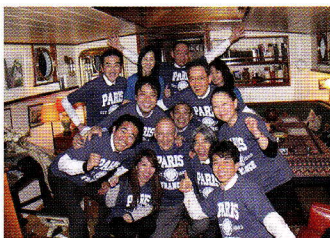
船上パーティにて