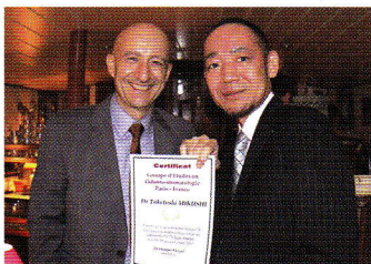
修了証授与式(右は筆者)